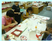
上手くてできるかなあ？

骨組みまでも紙製の団扇つくりは印象に残ったという意見があった中でマイ団扇を使用せずに飾って置くという意見が多かったです。節電が騒がれていますが、まだまだ暑い日々が続くので、体調に気を付けてエコ活動をすすめましょう。