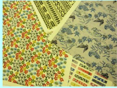
いろんな柄の和紙があります。