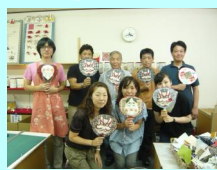
マイ団扇の完成です